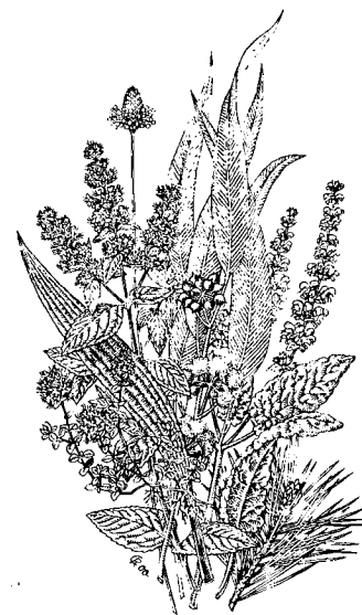
Heilpflanzen im WALA-Garten